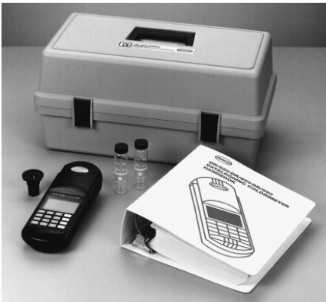
图 1 DR/800 系列色度仪标准包装*